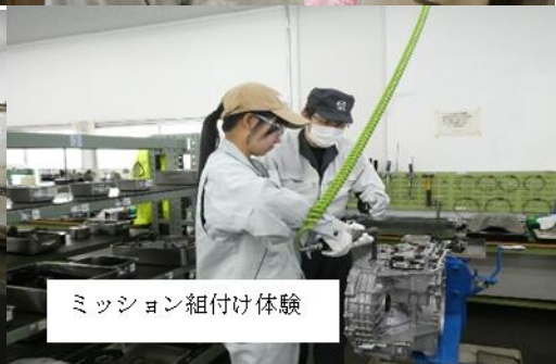
ミッション組付け体験