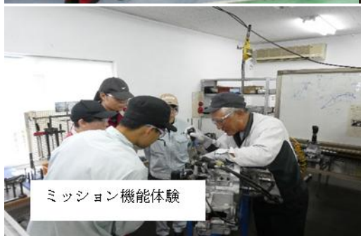
ミッション機能体験