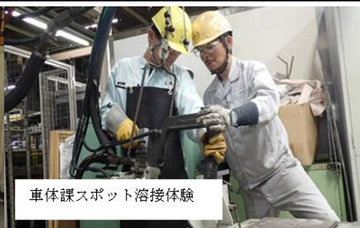
車体課スポット溶接体験