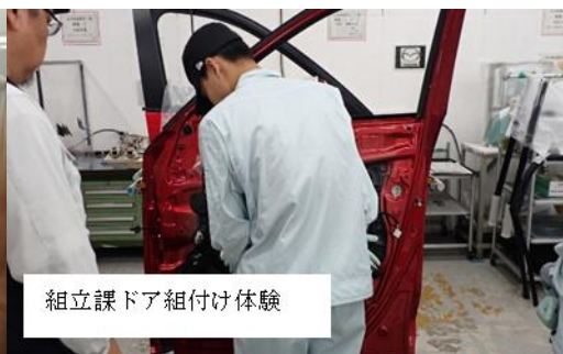
組立課ドア組付け体験