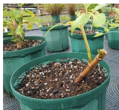
ダリアの切り戻し

以上の体験を通して、実際に働かれている方のお話を伺い、仕事に対する責任やうまく働くためのコツを学ぶことができた。社会では仕事を計画し、指示する役割の人、その指示を受け、作業をする人がいるが、それぞれの立場で異なる苦勞があることを互いが理解することが仕事をするうえで重要であると感じた。また、働くうえで身体の健康はもちろん、心の健康の重要性も学んだ。自分自身や周囲の人に対する些細な、気遣いや心掛け次第でストレスが緩和され、より働きやすくなるのだらうと感じた。イベントの企画などデスクワークだけでなく、現場での作業など両方を体験することができ、充実した5日間であった。